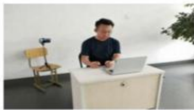
图 1 考生“双机位”设备摆放布置示意图